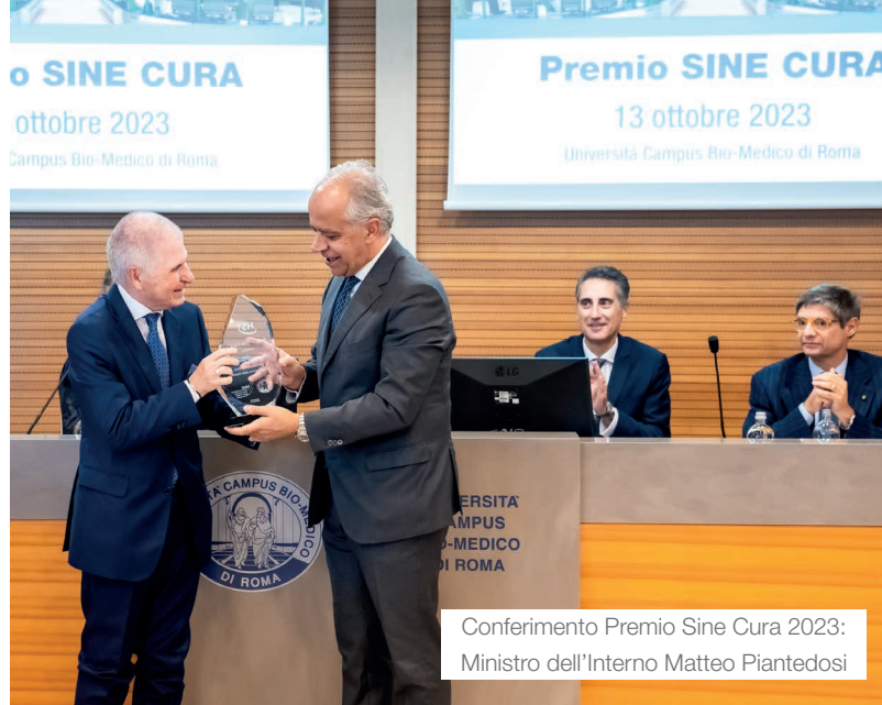
Conferimento Premio Sine Cura 2023: Ministro dell'Interno Matteo Piantedosi

Per i professionisti già occupati nel settore della sicurezza, il Master offre l'opportunità per arricchire il proprio Curriculum, ampliare il network di conoscenze in un settore in grande espansione e l'occasione per una crescita lavorativa e un avanzamento di carriera.