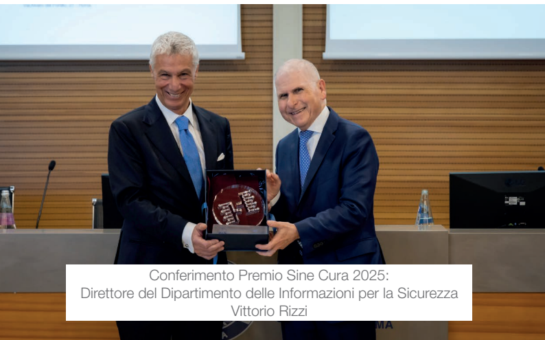
Conferimento Premio Sine Cura 2025: Direttore del Dipartimento delle Informazioni per la Sicurezza Vittorio Rizzi